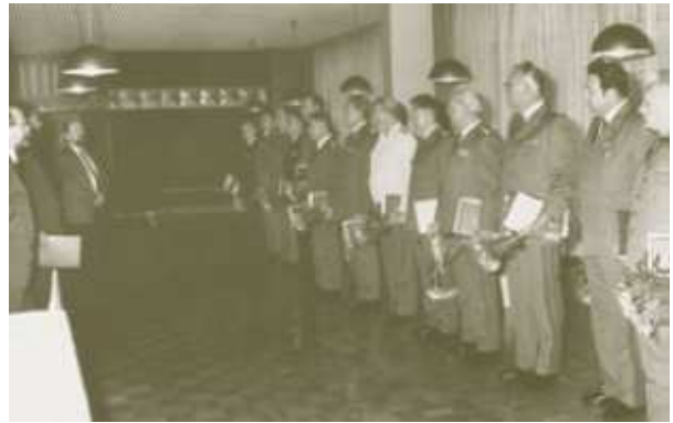
Abb. 20 Rainer Eppelmann entlässt NVA-Mitglieder, Strausberg

Herr Eppelmann war nach der friedlichen Revolution 1990 der CDU beigetreten und war von 1990 bis 2005 Mitglied des Deutschen Bundestages.