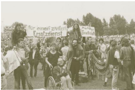
Abb. 18 Forderungen auf dem Kirchentag 1988 in Berlin

Mit den Demonstrationen in der DDR im Sommer/ Herbst 1989 wurde auch immer wieder die Forderung nach dem militärischen Ersatzdienst öffentlich geäußert.