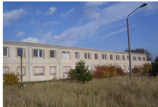
Abb. 13 Ein trostloser Anblick- das Militärgefängnis in Schwedt