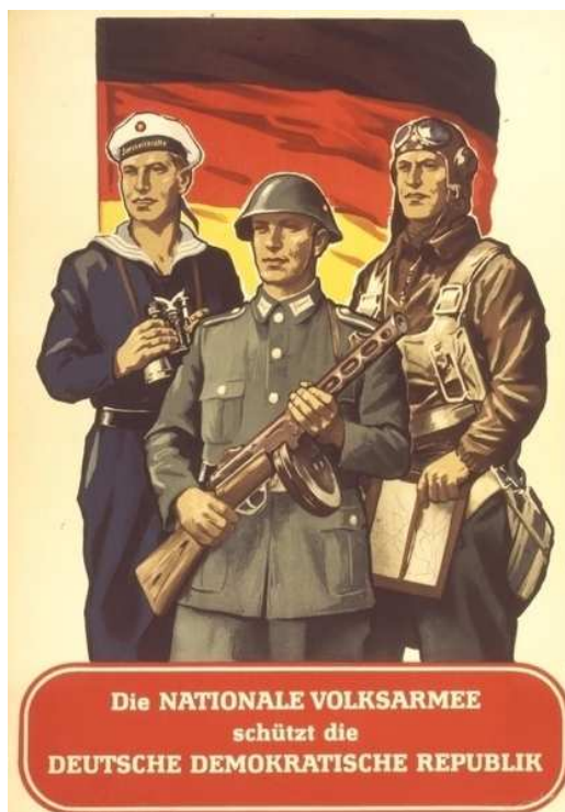
Abb. 1 Propagandaplakat der NVA

Die gesamte Bevölkerung wurde Anfang der 1960er Jahre immer mehr militarisiert. Bereits im Kleinkindalter bzw. im Kindergarten versuchte man die Kinder von den Soldaten und der Armee zu überzeugen und sie dafür zu begeistern. Dies setzte man dann in der Schule im Pflichtfach „Wehrerziehung“ (ab Ende der 1970er Jahre 8 ) fort.