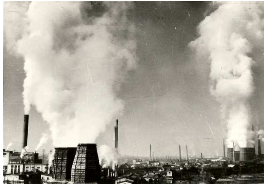
Abb. 6 Bitterfelder Industrielandschaft