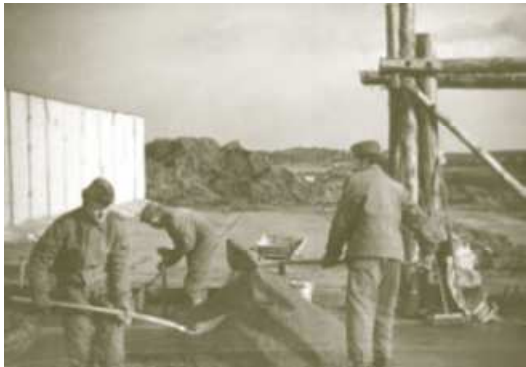
Abb. 14 Bausoldaten mit Schaufeln in Holzdorf

Da Bausoldaten in den Augen vieler Vorgesetzter unzurechnungsfähige kriminelle Personen gewesen waren, durften die diese an einigen Stationierungsorten beim Arbeiten keine Technik benutzen. So wurden die meisten Arbeiten ausschließlich in Handarbeit und mit Hacke und Spaten bzw. Schaufel ausgeführt.