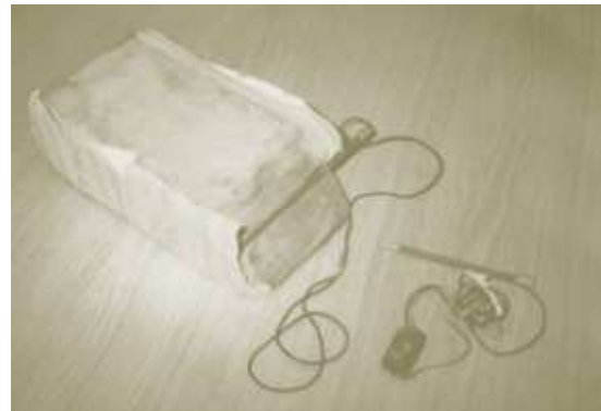
Abb. 16 Stabwanze im Mauerwerk

Zum Thema IM in den Baueinheiten und den Verdacht der Bausoldaten auf eine mögliche Bespitzelung fand ich in einer Akte des Staatssicherheitsdienstes folgende Aussage: