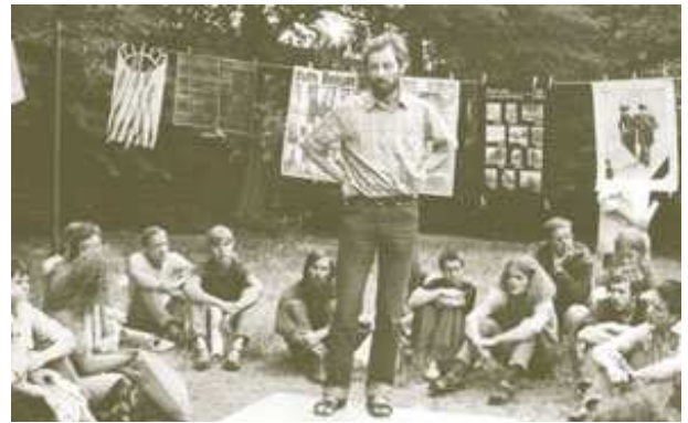
att in Berlin 1982

In den 1970er Jahren nahmen dann Beratungen der Wehrpflichtigen durch kirchliche Vertreter immer mehr zu. 44 So gab es Beratertage und Friedensseminare, die in vielen Fällen auch ehemalige Bausoldaten oder Totalverweigerer unter dem Dach der Kirche durchführten. Damit wollte man zukünftigen Wehrpflichtigen bei der Entscheidung pro normaler Wehrdienst oder pro Bausoldatendienst unterstützend und beratend zur Seite stehen.