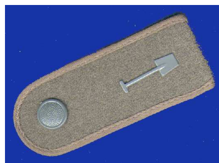
Abb. 12 Schulterstück mit Spaten

Während meines Vortrages über die Waffenverweigerer in der DDR in der Nerchauer Kirche, schenkte mir ein ehemaliger Bausoldat eine seiner einstigen Schulterklappen mit goldenem Spaten. Dieses Geschenk erachte ich als umso wertvoller, weil Bausoldaten diese Schulterklappen eigentlich