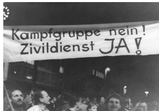
Abb. 19 Forderung nach dem Zivildienst

Dem kam dann schließlich die letzte SED-Regierung (unter Hans Modrow) nach und verkündete im November 1989 die baldige Einführung des Zivildienstes.