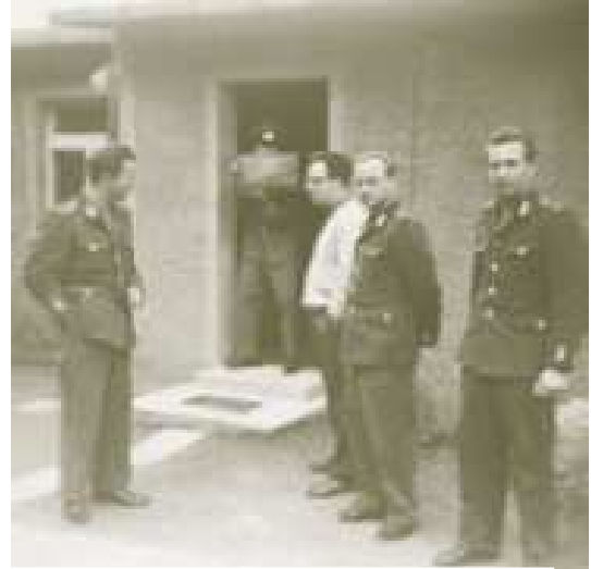
Abb. 4 Bausoldaten des ersten Durchgangs in Prenzlau

In der ersten Phase wurden die Bausoldaten zu geschlossenen Baueinheiten von 30 bis 100 Mann zusammengefasst. 21 In dieser Zeit mussten die Waffenverweigerer der DDR häufig an militärischen Bauvorhaben mitwirken, was für viele Bausoldaten einen Gewissenskonflikt und einen starken Kritikpunkt darstellte, da ja sämtliche Arbeiten für das Militär abgelehnt wurden. Am Bau von Raketenstartplätzen und Abschussrampen mitzuwirken, entsprach in den meisten Fällen keineswegs ihren Motiven.