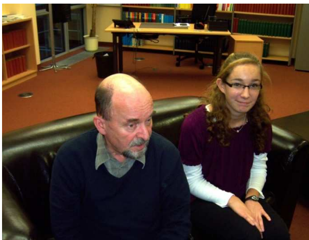
Abb. 3 während meines Gesprächs mit Rainer Eppelmann in seinem Berliner Büro

Er persönlich betonte, dass der Bausoldatendienst in der Öffentlichkeit nur sehr wenig bekannt gewesen sei. Er selbst habe in der Jungen Gemeinde von dieser Möglichkeit erfahren. Dies sei aber nicht überall der Fall gewesen.