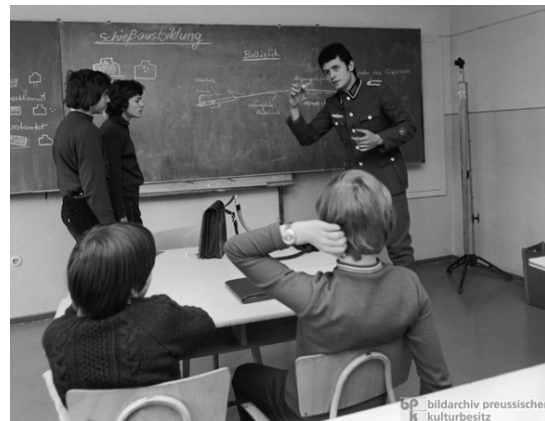
Abb. 2 Schüler während des Wehrerziehungs-Unterrichts in der DDR

Nachdem am 4. April 1962 die ersten Wehrpflichtigen eingezogen wurden, verweigerten allerdings 60 dieser Wehrpflichtigen am 13. April den üblichen Fahneid. 9