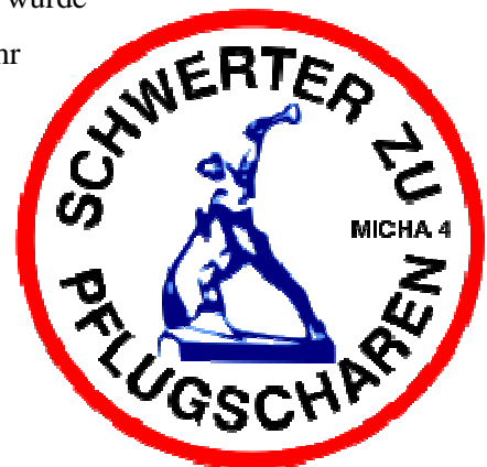
Symbol Schwerter zu Pflugscharen

1980 und 1981 gab es in der DDR zwei „Friedensdekaden“. Die erste wurde unter dem Motto „Frieden schaffen ohne Waffen“ durchgeführt und ihr Erkennungssymbol wurde die Plastik „Schwerter zu Pflugscharen“. Während der zweiten Friedensdekade (im November 1981), wurden die Aufnäher „Schwerter zu Pflugscharen“ ein Symbol für viele Jugendliche. Mit dem aufgenähten Zeichen, meist auf Jacken oder Taschen, verliehen sie ihrem Friedensbekenntnis Ausdruck. Die Regierung war allerdings mit solchen Bekenntnissen und dem öffentlichen Tragen der Aufnäher nicht einverstanden.