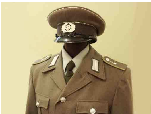
Abb. 11 Uniform der Bausoldaten

Gegen Ende der Baueinheiten führte man dann graue, aufgenähte Spaten aus Stoff auf den Schulterklappen ein.